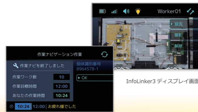
InfoLinker3 ディスプレイ画面