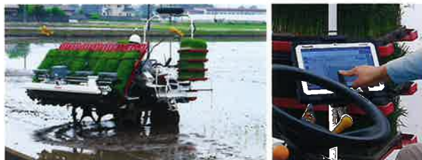
タブレットで簡単操作。

高精度測位方式RTK-GNSSを採用し、誰でもまっすぐの田植えを実現。さらに、区画整備された大区画ほ場では、旋回も自動運転が可能。連続自動作業で長時間でも疲労の軽減が図れます。